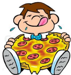
Il bambino mangia una pizza.