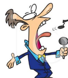
l) il cantante