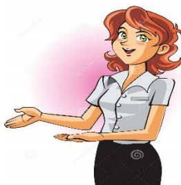
g) la commessa