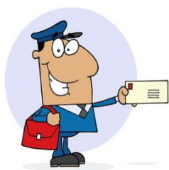
a) il postino