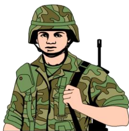
c) il soldato