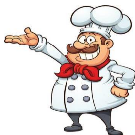
f) il cuoco