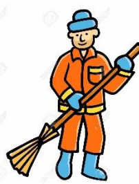
d) lo spazzino