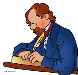
h) lo scrittore