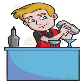
e) il barista