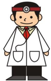
e) il medico