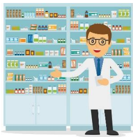
b) il farmacista