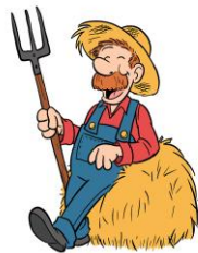
c) il contadino