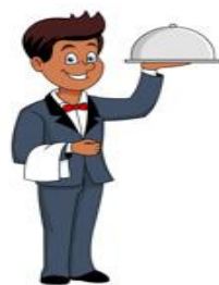
h) il cameriere