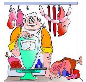
l) il macellaio