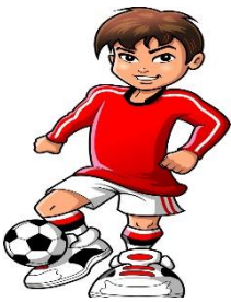
a) il calciatore

Cosa fanno queste persone? Unisci a ogni mestiere la frase corretta.