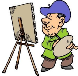
g) il pittore