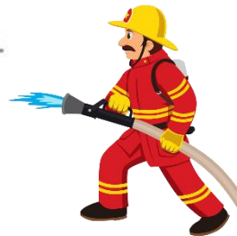
i) il pompiere